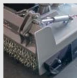
Porta traseira hidráulica 2 cilindros.