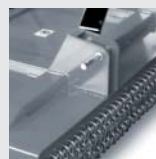
Sistema de engate.