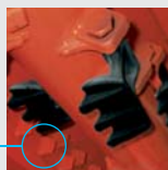
Barras de recorte